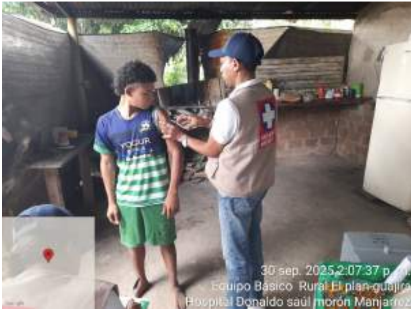
30 sep. 2025 2:07:37 p. m. Equipo Básico Rural El plan-guajira Hospital Donaldó saúl morón Manjarrez